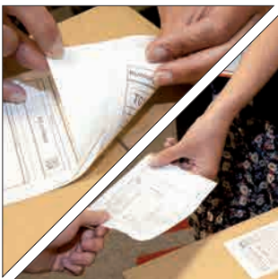
Peler et appliquer une étiquette de livraison en laissant la facture correspondante (ou la liste de prélèvement, les politiques et procédures de retour, l'enquête client, etc.

Le DB-EA4D est disponible avec des options de support pour rouleaux de papier, ce qui améliore encore la flexibilité et la gamme d'applications pour l'impression. Avec le logiciel Bartender en standard et la possibilité de télécharger un logiciel amélioré, l'utilisateur peut facilement concevoir l'étiquette pour répondre aux besoins de l'entreprise